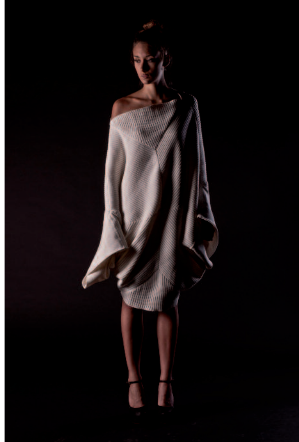
Capo di Eleonora Tranchida fatto con 100% cotone egitto gasato mercerizzato

L'Egitto è il principale produttore storico e attuale leader mondiale nella produzione di cotone a fibra lunga e extra-lunga. Il cotone long staple include le varietà Giza 86 e Giza 90. La buona qualità di questi cotone annovera caratteristiche simili al Supima americano: lunghezza delle fibre attorno ai